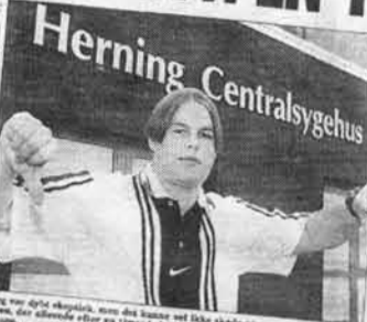
Mirakelmand sætte inkompete sygehuslæger til vægs